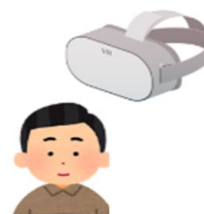
学び始めのオストメイトが、VR映像で「いつでも」「どこでも」「何度でも」良質なセルフケアを追体験できる

目標金額 400 万円 2023年 8月7日 (月) 9時～ 9月29日 (金) 23時まで