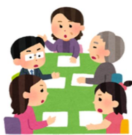
オストメイトと専門家による制作グループでのディスカッション

これまでオストメイトに関わる課題に挑み続けてきた先輩方の熱い思いと、これから発展するであろう新たな映像イノベーションを織り合わせることで、多くのオストメイトやオストメイトをサポートする方々に、安心や笑顔を届けられたらと考えています。あたたかいご寄付とご支援を何卒よろしくをお願いします。